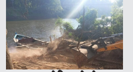
तळगाव खाडीकिनारी तीन