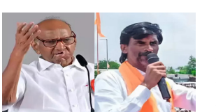
उत्तर दिले. प्रसारमाध्यमांशी बोलताना शरद पवार यांनी सांगितले की, तुम्हाला चौकशी करायची असेल तर अवश्य करा. तुम्हाला वाटेल ते करा आणि चौकशी पूर्ण करा. कर नाही त्याला डर कशाची, आमचा या सगळ्यांशी काहीच संबंध नाही. सत्ताधारी लोक म्हणत आहेत की, फोन केले होते, तसे वाटत असेल तर आमचे फोन तपासा आणि मनोज जरांगेसह त्यांच्या सहकाऱ्यांचे फोन तपासा, असे शरद पवार

मुंबई | प्रतिनिधी मराठा आरक्षण आंदोलन दिवसागणिक वेगवेगळे वळण घेताना पाहायला मिळत आहे. मनोज जरांगे पाटील यांची एस्टीआयटी मार्फत चौकशी करण्यात यावी, अशा सूचना विधानसभा अध्यक्ष राहुल नावेंकर यांनी सभागृहात दिल्या. मनोज जरांगे हे उपमुख्यमंत्री देवेंद्र फडणवीस यांच्यावर गेल्या काही दिवसांपासून सातत्याने टीका करताना दिसत आहेत. या टीकेला देवेंद्र फडणवीस यांनी विधानसभेत उत्तर दिले. या घडामोडींच्या पार्श्वभूमीवर मराठा आंदोलनामागे शरद पवार असल्याचा दावा केला जात आहे. याला शरद पवार यांनी