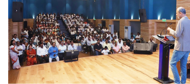
अंमलबजावणी करण्याचे आवाहन केले. स्वतःच्या बुद्धीला पटल्याशिवाय कोणतीही गोष्ट स्वीकारू नये, हे बाबासाहेबांचे तत्त्व प्रत्येकाने अंगीकारावे, असे ते म्हणाले.