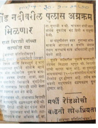
शाळेत जाणारी मुलं धोका पत्करतात, आपत्कालीन प्रसंगी लोकांना तासन्तास

पातळीचा पूल मंजूर झाला अशी घोषणा झाली तेव्हा लोकांनी क्षणभर दिलासा घेतला. पण लगेच नवा अडथळा कांदळवन तोडण्याची परवानगी. म्हणजे पुलाचं काम नाही, आधी फाईलचं काम! एकीकडे 'कोस्टल झोन', दुसरीकडे 'इको-परमिट', तिसरीकडे 'क्रोकोडाइल ऑब्झर्वेशन' या सगळ्यात पुलाच्या फाईलची पायपीट सुरुच आहे. गावकऱ्यांना मात्र सरकारच्या या विभागांनं त्या विभागाकडे दळलप्याच्या क्रिकेट मॅचीत रस उरलेला नाही. कारण त्यांनी रोज जिवाला घोर होत नदी ओलांडावी लागते,