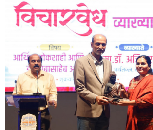
कामगारांचे हक्क, सामाजिक सुरक्षा यासारख्या क्षेत्रातील बाबासाहेबांचे विचार आजही तितकेच सुसंगत असल्याचे त्यांनी विविध उदाहरणांतून मांडले.

समता, स्वातंत्र्य, बंधुता या मूल्यांबरोबरच कोणीही कनिष्ठ नाही ही भावना जपणं महत्त्वाचं आहे, असे त्यांनी अधोरेखित केले. आर्थिक विषमता पूर्णपणे नाहीशी होणार नसली तरी ती किमान पातळीवर ठेवणे गरजेचे असल्याचे त्यांनी स्पष्ट केले.